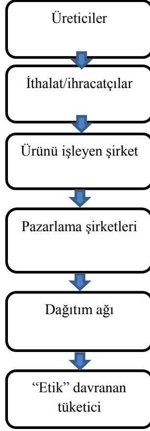
Şekil 2: Adil Ticaret Modeli'nin Aktörleri

Adil ticarete konu olan ürünlerin satışı iki farklı model ekseninde gerçekleştirilmektedir. Birinci yaklaşım çerçevesinde firmalar Güney'deki üreticilerden satın aldıkları tarım veya el işi ürünlerini belirli kriterleri sağlayarak adil ticaret sertifikası alıp “adil” olarak etiketlenmiş ürünler olarak piyasaya sunmaktadır. Bu yaklaşımda satışı gerçekleştiren firmalar sertifikalandırılmaktadır. İkinci yaklaşım çerçevesinde ise, Güney'deki üretici firmalar, ürünleri için adil ticaret sertifikası alır, bu ürünün satışı veya dağıtımını gerçekleştirmek isteyen firmaların tüm ticari faaliyetlerinin adil ticaret sertifikası almış olması gerekmektedir, sadece söz konusu ürün için adil ticaret koşullarını sağlaması yeterlidir.