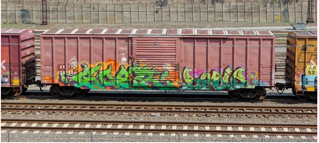
Görsel 2.4 Goer& Rebis, tren üzerine graffiti uygulaması.

dikkat çekiciliği ve estetik unsurlar ön plana çıkartılabilmektedir (bkz. Görsel 2.4). Tag ise bu açıdan graffiti uygulamasından ayrılmakta, başarılı bir tag uygulaması nicelik ile öne çıkmaktadır. Bunun sebebi tag atan kişilerin isimlerinin ne kadar çok yerde, ne kadar fazla sayıda insan tarafından görüldüğünün, grubun bir parçası olarak kabul edilmelerini kolaylaştırmak adına önemli kabul edilmesidir. Her iki uygulamada da nitelik veya nicelik doğrultusunda gelen görünürlük, gruplar arasında hiyerarşiyi belirleyen bir kriter olarak kabul edilmektedir.