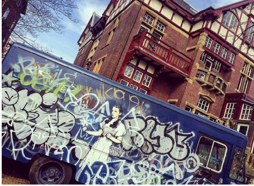
Görsel 2.3 Hollanda'da graffiti, Amsterdam, 2017

Ortak bir görsel dil oluşmasını sağlayan bahsi geçen öğeler, çoğunlukla açık havada çalışma koşullarından, el çabukluğu gerekliliğinden ve kullanılan malzemelerin getirdiği sınırlamalardan kaynaklansa da zamanla benimsenmiş; örneğin boyadan bir yol oluşturacak şekilde süzülen damlalar, sıçrayan boya partikülleri gibi karakteristik özellikler haline gelmiş kimi görsel öğeler, kendiliğinden oluşmadığı