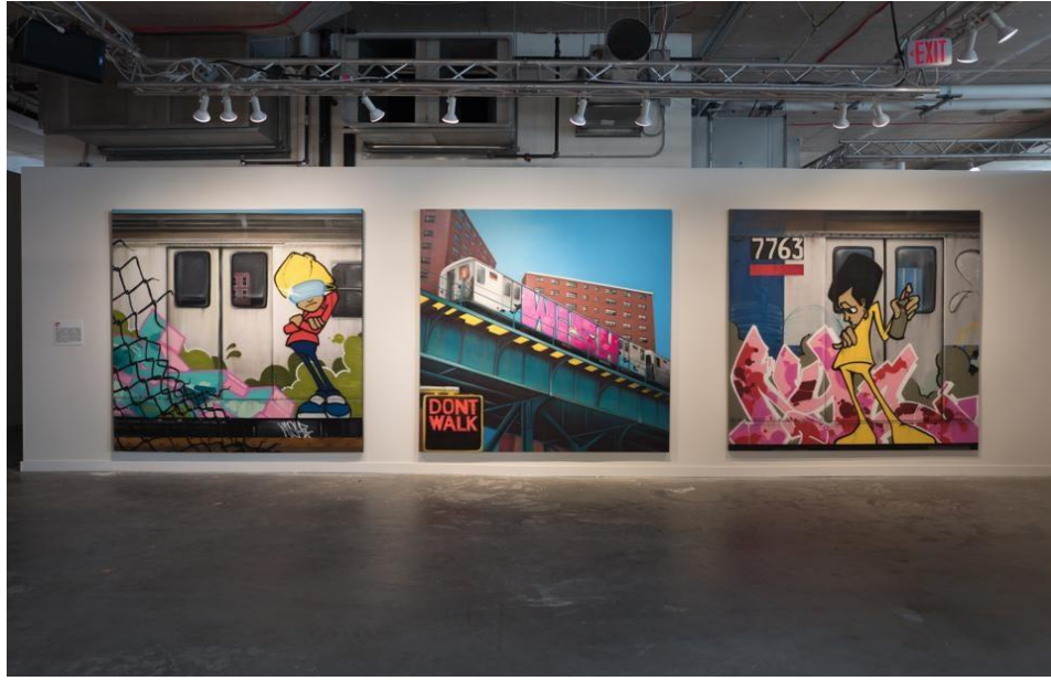
Görsel 2.7 Ces, Beyond the Streets sergisi, Fondation Cartier, 2010.

pazarlandığını” öne sürmüştür (s.246) (bkz. Görsel 2.7).