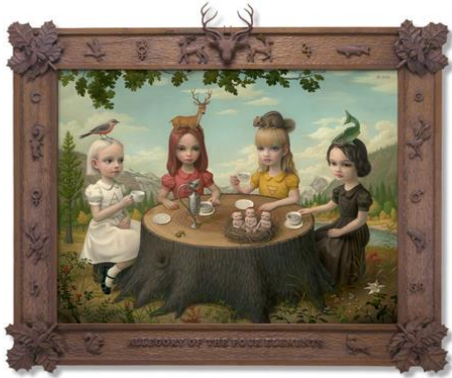
Görsel 3.1 Mark Ryden, Allegory of the Four Elements, tuval üzerine yağlı boya, 70x90 cm, 2006. Kaynak: www.markryden.com

Sanat nesnesine dair tekrar canlanan ilgi ve pentür geleneğinin geri dönüşünü vurgulayan isimlerden biri olarak Davis (2013), alternatif sanat hareketlerine de değinmiş; aykırı, dışlanmış sanat türlerine (outsider art) ve halk sanatına (folk art) dair ilgide yeni ve dikkat çekici bir artışı ortaya koymuştur (s.544-580). Bunun yanı sıra sanat nesnesine verilen önemin ve nesneye odaklanan bakış açısının değişmeye başlaması, deneyim üzerine yeni bir odak oluşturulmasına da yol açmıştır.