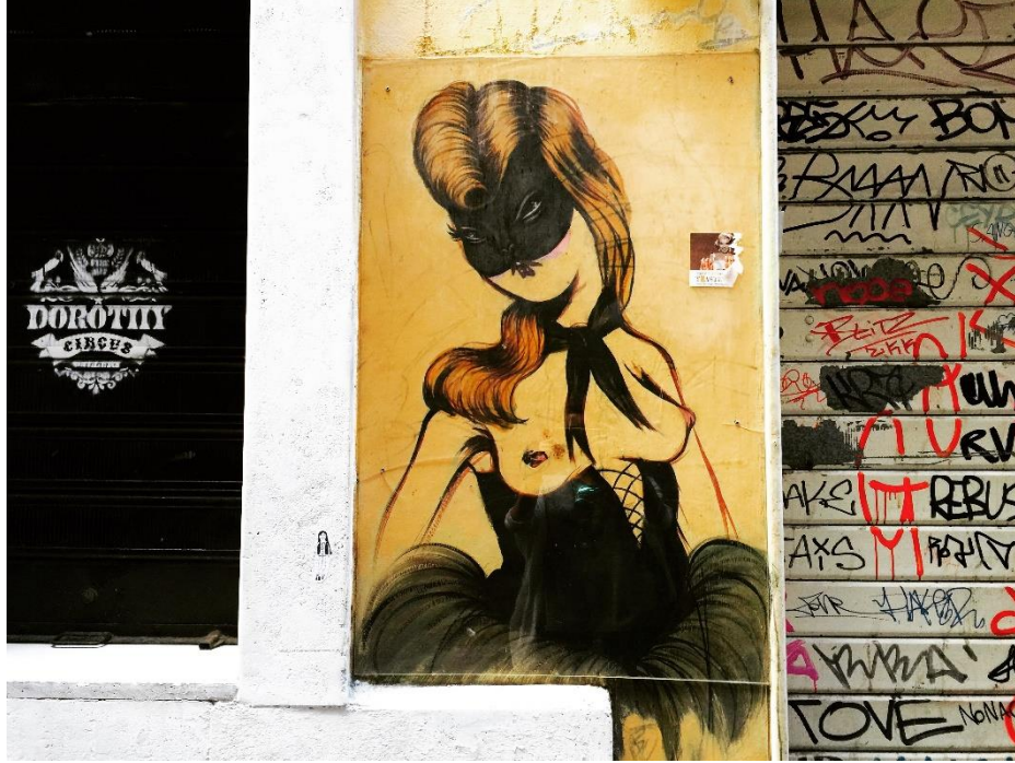
Görsel 2.22 Miss Van, duvar resmi, Roma, 2015.

Çevresel etki ve beyaz duvarın sokak sanatına etkisi üzerine bir karşılaştırmada bulunmak adına bir sanatçının iki farklı ortamda yer alan işlerine bakılmıştır. Görsel 2.22'de İtalya'nın Roma şehrinde Eylül 2015 tarihinde fotoğraflanmış, Miss Van takma isimli sanatçıya ait bir duvar resmi yer almaktadır.