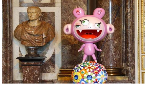
Görsel 3.13 Takashi Murakami, Versailles Sarayı sergisi, Paris, 2010.

3.13). Japon kültür eleştirmeni Yoshiko Shimada, Murakami'nin superflat teorisine karşı eleştirel yaklaşımda bulunan kişilerden olmuştur ve superflat dahilinde benimsenen tavrı “Japon kültürünü bir Batılı'nın 'egzotik' Japon altkültürüne olan hayranlığını tatmin edebilecek şekilde basitleştirmek” ile itham etmiştir (Koh, 2010, s.4). Bu kendini oryantalleştirme pratiğini geliştiren ve bu tavır aracılığıyla kendini ifade etmeyi ve kimliğini bu şekilde, dışarıdan bakıldığı, algılandığı haliyle ele alarak bu bakışın abartılı bir versiyonunu ortaya koymayı tercih eden Murakami; böylelikle “Batı'nın Doğu'ya duyduğu büyümeyle olan ilgiyi küresel sanat kanonuna dahil olabilmek adına kullanmıştır” (Dornhof vd., 2018, s.289). Bu ilgi, bu strateji ve beraberinde gelen yükseliş bir altkültüre dair öğelerin beklenmedik buluşmalar dahilinde gün yüzüne çıkarak yüksek sanat, müzayedeler ve moda ile bir araya gelmesini sağlamış; böylelikle farklı bir kurumsallaşma örneği ortaya çıkmıştır.