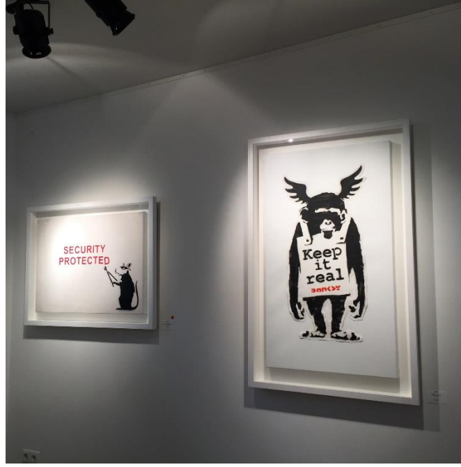
Görsel 2.31 Banksy, Lionel Gallery, Amsterdam, 2017.

Müze giren sokak sanatının sunduğu deneyimin eksikliği ve kısıtlılığı ile ilgili yukarıdaki örnek üzerinden yapılmış olan saptamalar sokak sanatı ve sanat piyasası kavramlarının aslında ne kadar zıt olduğunu tekrardan hatırlatmaktadır. “Anlamları sanat dünyasının dışında olma durumu ile bağlantılı olmaları sebebiyle bu dünyadan büyük ölçüde kopuk bir pratik” olarak nitelendirilebilen sokak sanatı bu şekilde bir yandan da kendini bu dünyaya olan uzaklığı üzerinden tanımlamaktadır (Frederick, 2016, s.11). Bu uzaklık, bu iki zıt kavramın buluşması durumunda sokak sanatının özünde yaşadığı eksilmelerin bir “bedel ödeme” şeklinde tanımlanmasına da sebep olabilmektedir: