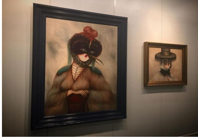
Görsel 2.23 Miss Van, Contemporary Istanbul Sanat Fuarı, İstanbul, 2016.

farkedilebilmektedir. Kimi yasa dışı uygulamalardan farklı olarak bu duvar resmi dış faktörlerden mümkün olduğunca uzak durabilmesi adına bir pleksiglas levha arkasında koruma altına alınmıştır. Bu korumanın gerçekleşebilmesi, bulunduğu duvarın Dorothy Circus isimli galerinin mülkü olması sayesinde mümkün olmuştur. Bu levhanın söz konusu duvar resmi üzerindeki tek işlevi onu iklimsel koşullar veya vandalizm gibi olası dış faktörlerden korumak şeklinde gerçekleşmektedir, çünkü levha dışında kalan korumasız alan değiştikçe orada yer alan resim de buna uyum sağlayabilecek bir konumdadır. Bunun yanı sıra levha üzerine yapıştırılmış küçük bir etiket sayesinde oluşan etki söz konusu fotoğrafta da görülebilmektedir. Görsel 2.23'de ise yine aynı sanatçıya ait, taşınabilir bir yüzey üzerine gerçekleştirilmiş işler beyaz bir duvar önünde görülmektedir.