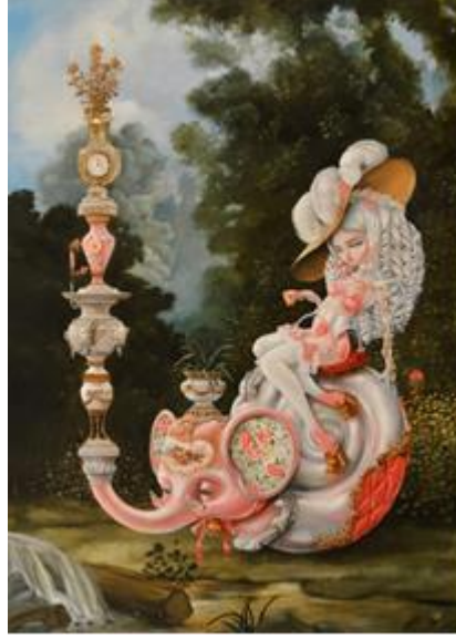
Görsel 3.4 Kukula, Fragile Delights, panel üzerine yağlı boya, 121.9 × 91.4 cm, 2019.

Özellikle lowbrow ve ağırlıklı olarak pop sürrealizm sanatçılarının bağ kurdukları sürrealizm, pre-raphaelite kardeşliği gibi oluşumlara bakıldığında sanat tarihi boyunca tekerrür eden bir saptamada bulunmaktadır; her yeni hareket, her yeni fikir, her yeni yaratıcı düşünce ve davranış biçimi, alışılmışın dışına çıkan her yeni uygulama ya da önerme ilk ortaya çıktığında dönemin otoritelerince veya izleyici kitlelerince tolere edilmesi mümkün olmayan bir davranış, hatta bir saldırı şeklinde algılanabilmektedir. Sanat tarihi içerisindeki neredeyse tüm akımlar dönemlerinde benzer tepkilerle karşı karşıya kalmışlardır. Örneğin fovizmin kendini ilk göstermeye başladığı yıllarda o dönemin etkili sanat eleştirmenlerinden biri olan Louis Vauxcelles, fovistlerin işlerini ilk eleştirenlerden biri olmuş ve tepkilerini şiddetli bir şekilde şu sözcüklerle ifade etmiştir: