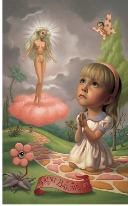
Görsel 3.2 Mark Ryden, Saint Barbie, panel üzerine yağlı boya, 1994.

Performans sanatı gibi örneklerin yanı sıra galerilerde yer alan sokak sanatı da bu deneyim fikri üzerinden tekrar değerlendirildiğinde; bir önceki bölümde bahsedildiği şekilde izleyiciye sokağa dair, yasa dışı olana dair, bu yaşam tarzına, bu üretime ve belli bir döneme dair bir deneyimi, bir kurum çatısı altında sunma önermesi de burada doğru bir örnek olarak yer almaktadır. Bu durumda, bu tarz sergilerde sunulan nesneye odaklanmak yerine, bu nesnelere sunulan deneyime dair birer belge olarak değerlendirildiğinde konuya daha geniş ve farklı bir açıdan yaklaşılabilmekte, böylelikle günümüz sanat ortamı içerisinde bu tip alternatif oluşumların yükselişi de daha doğru bir şekilde değerlendirilebilmektedir. John Davis'in belirttiği gibi, oluşan bu yeni ve elverişli zeminde farklı bir deneyime odaklanan ve nesneyi geri plana alan hareketlerin yanı sıra, bir zamanlar dışlanan ve aşağılanan kimi sanatsal ifade biçimleri de ilgi görmeye başlamıştır.