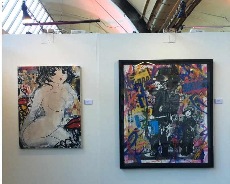
Görsel 2.20 Hush (solda) ve Mr.Brainwash (sağda), Stroke Art Fair, Münih, 2017