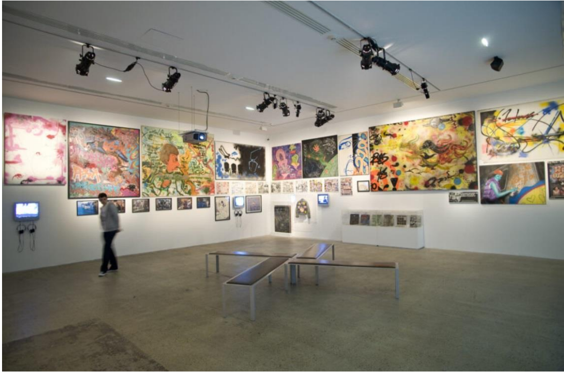
Görsel 2.28 Born in the Streets sergisi, Fondation Cartier, Paris, 2009.

Sokaktaki yasa dışı uygulamalar için tehlike unsuru bir karakter haline gelmiştir ve bu durum yukarıdaki alıntıda bahsedildiği şekilde yapıtın aurasına yansımalarının dışında, içerik, üslup ve malzeme seçimine kadar pek çok farklı kategoride de görülebilmektedir. Kurumsallaşmış sokak sanatında bulunan en büyük çelişki, karakterinin, varoluşunun bir parçası olan bu öğenin bir kurum çatısı altına girdiği anda ondan alınıyor olmasıdır. Bunun sebebi, müze ve galerilerin güvenli, sınırları belli, yapıtları koruma altında tutan mekanlar olması ve sokaktaki durumun aksine bir yapıtın bu mekanlarda bulunmasının başlı başına bir suç teşkil etmiyor olmasıdır. Böylelikle denilebilir ki müze, galeri gibi bir kurum sokak sanatı sergilediğinde, sokakta bulunan yasa dışı bir yaratıma dair tehlike unsuru ortadan kalkmakta ve yapıt tamamen güvenli, steril bir alanda deneyimlenmektedir (bkz. Görsel 2.28 ve 2.29).