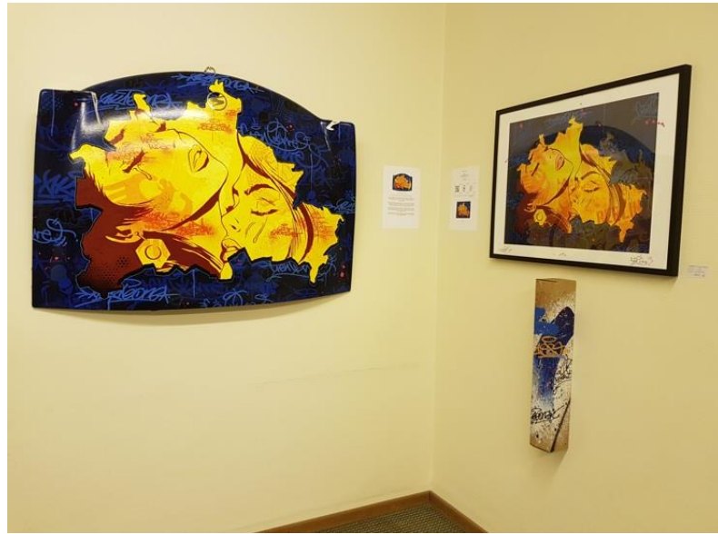
Görsel 2.27 Cren ve Akte One'a ait orijinal yapıt (solda) ve sınırlı üretim baskı (sağda), ArtMuc sanat fuarı, Münih, 2019.