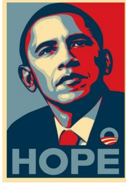
Görsel 2.9 Shepard Fairey, Hope, 2008, litografi, 86 × 61 cm. Kaynak: https://www.artic.edu/artworks/229396/barack-obama-hope-poster

Amerika başkanlık seçimleri için Barack Obama'nın seçim kampanyası posterini tasarlayarak (bkz. Görsel 2.9) dikkat çekmiş, 2017 yılında Münih'te gerçekleşen Stroke Art Fair (bkz. Görsel 2.10) gibi pek çok fuarda yer almıştır.