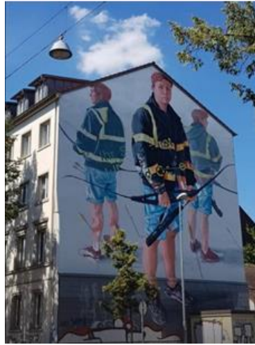
Görsel 2.17 Fintan Magee, duvar resmi, Saarbrücken, 2018