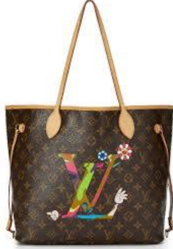
Görsel 3.11 Takashi Murakami'nin Louis Vuitton markası için tasarladığı bir çanta.