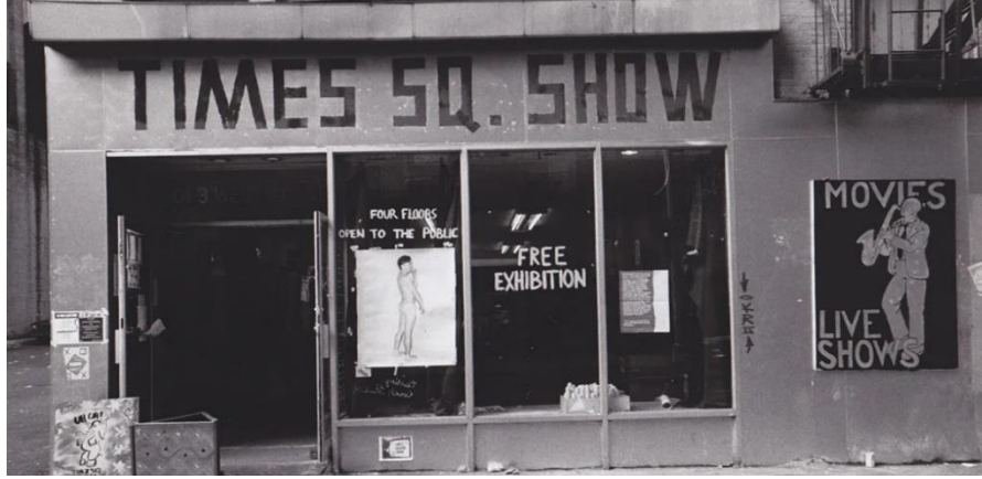
Görsel 2.11 Times Square Show, 1980, New York.

Aynı kitapta Haring bu sergiye katılan sanatçıları sayarken Quinones'dan “en iyi graffiti sanatçılarından biri” şeklinde bahsetmiştir (Gruen, 1992, s.65). Yer aldığı sergilerin dışında Adidas gibi önemli markalarla imzaladığı sözleşmelerle de ses getiren Quinones, eserleri ile Whitney Museum of American Art ve the Groninger Museum gibi müzelerin koleksiyonlarına katılma şansını da yakalamıştır. Quinones, kendi sözleriyle sanat anlayışını şu şekilde özetlemiştir: