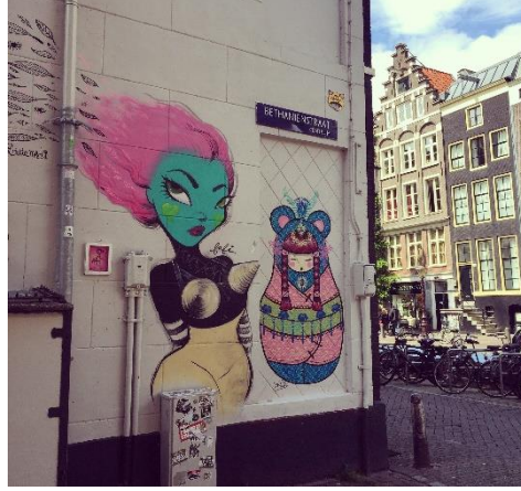
Görsel 2.25 Fafi, duvar resmi, Amsterdam, 2015.

Görsel 2.26'da ise Amsterdam'da bir galerinin sabit ışıklı ve beyaz duvarlı yerleşimi dahilinde deneyimlenen Banksy'e ait bit işe dair fotoğraf, galeri koşullarının yapıt üzerindeki çevre faktörlerini dönüşüme uğratma şekline bir örnek olarak paylaşılmıştır.