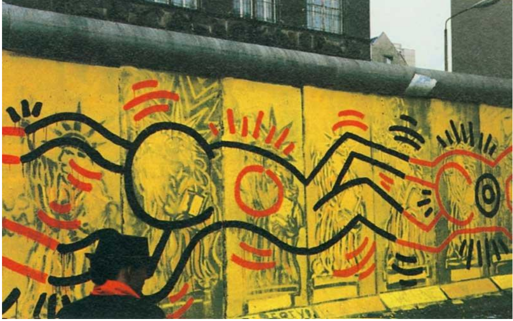
Görsel 2.16 Berlin Duvarı