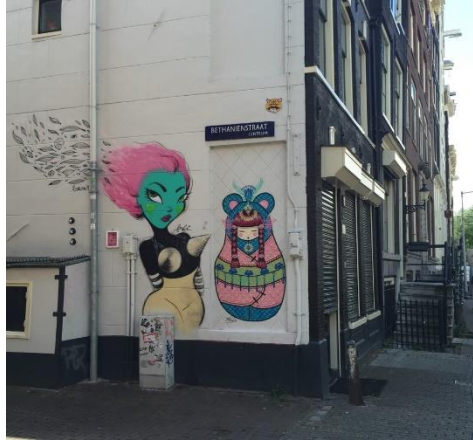
Görsel 2.24 Fafi, duvar resmi, Amsterdam, 2015.

Çevre faktörünün incelemesi adına yapılan bir diğer karşılaştırma, bir sanatçının sokakta yer alan bir işinin günün farklı saatlerinde, farklı açılardan fotoğraflanması şeklinde gerçekleştirilmiştir. Görsel 2.24 ve Görsel 2.25'de örneklenen Fafi takma isimli sanatçıya ait duvar resmi, Hollanda'nın Amsterdam şehrinde Haziran 2015 tarihinde, aynı sokakta, farklı açılardan, bir kaç saat ara ile fotoğraflanmıştır. Bu iki fotoğrafın karşılaştırılması ile çevre faktörünün sokakta bulunan bir iş üzerindeki etkisinin günün hangi saatinde, hangi açıdan, hangi genişlikte bakıldığına göre algıda oluşabilen değişiklikler şeklinde kendini gösterdiği saptanmıştır. Bu resim, sabit ışıklı beyaz bir galeri duvarında yer alıyorsa bu durum onun tüm bu faktörlerden bağımsız bir şekilde algılanmasına yol açacaktı.