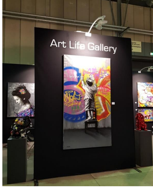
Görsel 2.32 Art Life Gallery, Luxexpo Luxembourg Art Fair, Lüksemburg. 2017

edilmiştir. Sanat piyasası – sokak sanatı bağlantısının vurgulandığı Görsel 2.32'de, Lüksemburg'da gerçekleşen ve kendini lüks tüketim fikri üzerinden tanımlayan bir sanat fuarında sokak sanatı bağlantılı işlerin sergilendiği gösterilmektedir. Değişim ve dönüşüm görünür biçimde ortadadır.