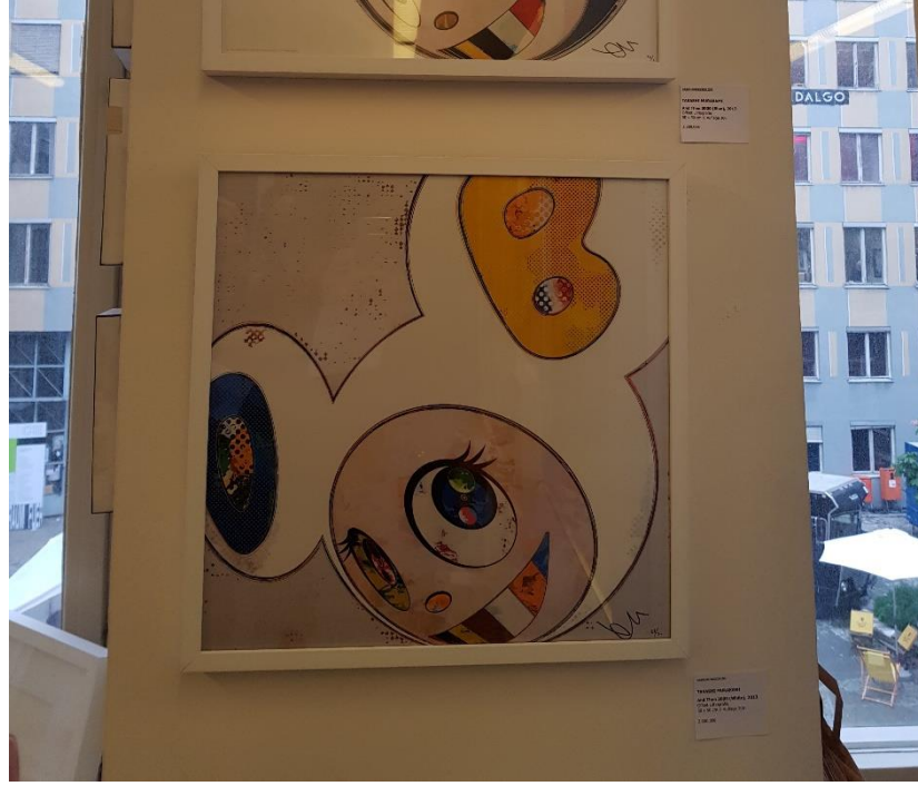
Görsel 3.10 Takashi Murakami, Mr.DoB, Stroke Art Fair, Münih, 2019.

Superflat akımının kalesi olarak nitelendirilebilecek yer, Takashi Murakami tarafından 1996 yılında kurulan ve Andy Warhol'un "Factory" ismini verdiği yaratım alanına benzer şekilde fabrika sözcüğü ile nitelemeyi seçerek "Hiropon Factory" ismini verdiği stüdyodur ve o tarihten itibaren bu alan, Robert Williams ve lowbrow örneğine benzer bir şekilde aynı fikir, motivasyon ve yaklaşımları paylaşan sanatçıların toplanma alanı olmuş, bu sanatçılar sayesinde de günden güne büyümüştür. İsmindeki fabrika sözcüğünün de vurguladığı şekilde, çok sayıda asistanın çalıştığı Tokyo merkezli bir buluşma ve üretim alanı olarak Hiropon Factory, "yüksek sanat ve ticari sanat arasındaki ayrımları silikleştiren bir mekan" şeklinde nitelenmiştir (Darling, 2001, s.77). Murakami 2001 yılında 'yüzleşme' olarak tanımlanabilen tarzından 'kawaii' yani sevimli yeni tarzına doğru yöneliminin bir sembolü olarak Hiropon Factory'yi kapatarak stüdyosunun adını Kaikai Kiki olarak değiştirmiştir (Lubow, 2005). Onlarca asistanın desteğiyle yürüyen çalışmaların yanı sıra Kaikai Kiki çatısı altında Murakami, aralarında Chiho Aoshima, Aya Takano gibi isimlerin de bulunduğu pek çok farklı sanatçıya da yer vermiştir.