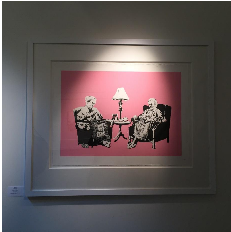
Görsel 2.26 Banksy, sınırlı üretim sanatsal baskı, Lionel Gallery, Amsterdam, 2015. Fotoğraf: İpek Ergen.

Görsel 2.26'da ise Amsterdam'da bir galerinin sabit ışıklı ve beyaz duvarlı yerleşimi dahilinde deneyimlenen Banksy'e ait bit işe dair fotoğraf, galeri koşullarının yapıt üzerindeki çevre faktörlerini dönüşüme uğratma şekline bir örnek olarak paylaşılmıştır.