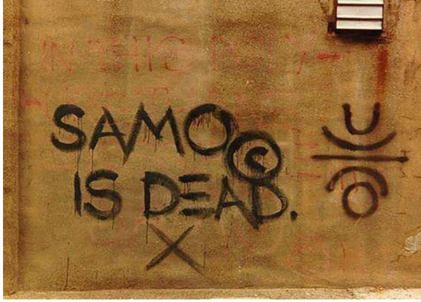
Görsel 2.12 SAMO is dead

Basquiat'ın tuval üzerine gerçekleştirdiği çalışmaları ve diğer işleri tavrı olarak graffiti ile benzerlik göstermektedir; bu işler kendiliğinden gerçekleşen, spontane bir yaklaşıma sahip olsa da, aslında görüldüğünden daha fazla 'üzerinde düşünülmüş' bir niteliğe sahiptir (Miller, 1983). Burada Basquiat üzerinden vurgulanan konu genel olarak graffiti ve sokak sanatı uygulamalarına uyarlanabilmektedir. Özellikle graffiti, ya da tag uygulamaları özensizce, hızlıca, spontane bir şekilde tamamlanmış izlenimi verse de, çoğunlukla uzun ve titiz bir planlama, hesaplama ve ön hazırlık aşamasının ürünüdür. Bunun asıl sebeplerinden biri sokakta yapılan çalışmalarda, özellikle de yasa dışı olanlarda, koşullardan dolayı uygulamanın mümkün olduğunca hızlı yapılmasının gerekliliğidir. Graffiti benzeri uygulamaların üzerinde dönüp tekrar tekrar çalışma, düzeltmeler yapma gibi durumlara her zaman müsaade etmeyebileceği de göz önünde bulundurulmalıdır. Bu bahsedilen durumlar çoğunlukla hazırlık aşamasının daha uzun ve detaylı olması gerekliliğini beraberinde getirmektedir. Macdonald (2001), bu duruma değinirken “duvardaki final formunda alelacele karalanmış bir kaos gibi görülen şeyin aslında derine köklenmiş düzen ve disiplini gizlediği” vurgulamıştır (s.75). Bu fikirden yola çıkarak, bitmiş işle karşı karşıya kalındığında deneyimlenen bir nevi düzenli kaos halinin, graffiti görselinin hedeflediği bir hal olduğu varsayımında bulunulabilmektedir.