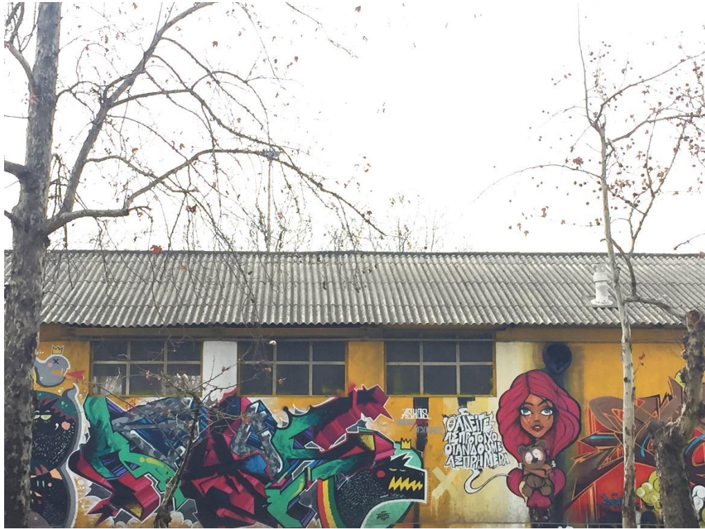
Görsel 2.1 Yunanistan'da Graffiti, Selanik, 2017

grafik bir etki yaratacak şekilde tasarlanmış olabilmekte, kimi zaman eklenen semboller ya da figürlerle bir yazı – resim birlikteliği yakalanabilmekte, kimi zaman ise yazıların tasarımı ve üzerindeki grafik oyunlar okunmasını zorlaştıracak düzeye varabilmektedir (Bloch, 2012, s.124). Fırça kullanımı nadir olsa da fırçanın yüzey üzerinde aceleyle hareket etmesinden, ya da sprey boyanın hızlı geçişlerinden oluşan sıçramış boya lekeleri, sprey boyanın çok yakından tutulması veya hızlıca çekilmesi sonucunda harflerin altından süzülerek akan damlaların oluşturduğu renkli hatlar, sprey boya veya keçeli kalemlerle yapılmış kalın kontürler (bkz. Görsel 2.2), sprey boya geçişleriyle renk tonları arasında verilen degrade görüntüler, harflere üç boyutlu yanılması oluşturacak şekilde derinlik verilmesiyle yaratılan göz oyunları (bkz. Görsel 2.1), stencil adı verilen elde ya da makine yardımıyla kesilmiş şablonlar aracılığıyla eklenen harf ya da şekiller gibi çeşitli uygulamalar ve tüm bunların üst üste binmesiyle oluşan kompozisyonlar (bkz. Görsel 2.3) graffiti söz konusu olduğunda ortak bir görsel dil haline gelmiş öğelerdir.