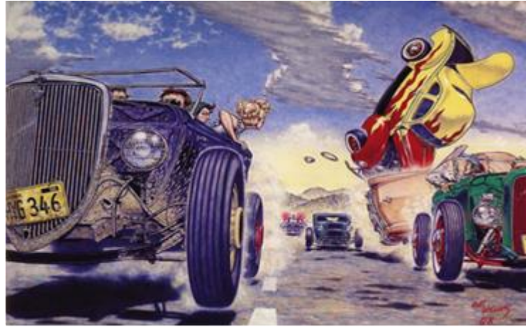
Görsel 3.3 Robert Williams, The Hot Rod Race, 1976.

Burada bahsi geçen hot-rod araba modifikasyon kültürü, zamanla oluşan ortak bir estetik dil etrafında gelişmiş ve bu estetik dile ait öğeler lowbrow sanatının oluşmasına ilham olmuştur. Bu tarzda modifiye edilen arabaların üzerinde sıklıkla görülen damalı desenler, kurukafa, alev gibi motiflere ve araçların dekorasyonunda kullanılan parlak renkli sedefli boyalara, lowbrow alanında çalışan sanatçıların işlerinde de rastlanmaktadır. Bunun yanı sıra Robert Williams gibi hot rod kültürü içerisinde gelişmiş sanatçılar, bu kültüre ait öğeleri, araba yarışı gibi konuları ve hatta arabaların kendisini de sanat pratiklerinde kullanmışlardır. Görsel 3.3'de “The Hot Rod World of Robt.Williams” başlıklı kitabın kapağında yer alan, sanatçıya ait “The Hot Rod Race” isimli 1976 tarihli yapıt görülmektedir.