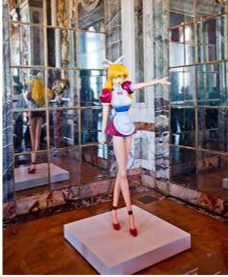
Görsel 3.14 Miss Ko2, Takashi Murakami, Versailles Sarayı, Paris, 2010.

hemen ardından yapılan farklı atılımlar Murakami'nin sanat kariyerinin gidişatını yönetme biçimi ve sanat – tasarım – tüketim ilişkisine dair bakış açısı, tüm bunların yanında dışlanmış bir altkültürün yüksek sanat ve tüketim kültürü ile kurduğu ilişki dinamiklerini ortaya koyan önemli adımlar olarak kabul edilmiştir.