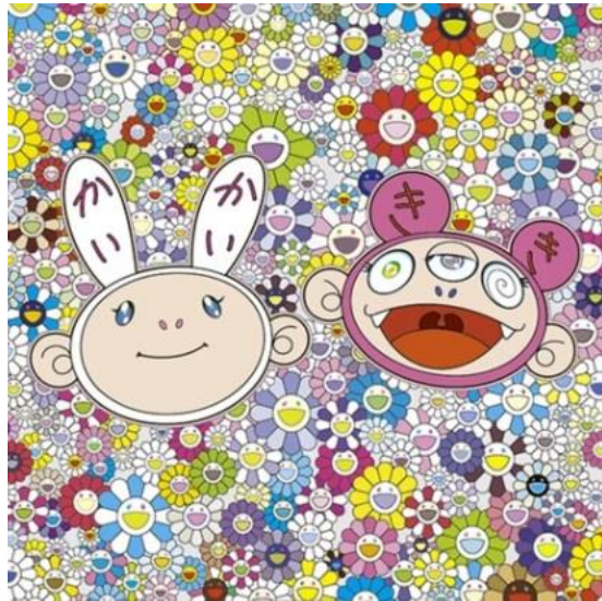
Görsel 3.9 Takashi Murakami , Kaikai & Kiki: Dreaming of Shangri-La, litografi,