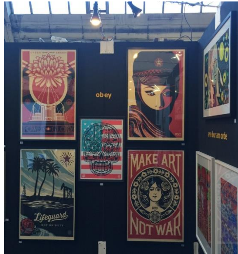
Görsel 2.10 Obey (Shepard Fairey), Stroke Art Fair, 2017, Münih.

Graffiti - sanat dünyası birlikteliği konusunda öne çıkan sanatçılardan bir diğeri, Puerto Rico doğumlu bir sanatçı olan Lee Quinones'dur. 1970-80 yılları arasında New York'ta ağırlıklı olarak trenler üzerine yaptığı uygulamalar ile tanınan Quinones;