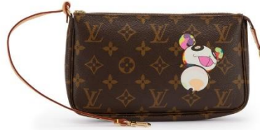
Görsel 3.12 Takashi Murakami'nin Louis Vuitton markası için tasarladığı bir çanta. Kaynak: www. sothebys.com

Ortak bir tavır olarak neredeyse tüm superflat sanatçılarının “her şeyi kapsayan bir tüketici kapitalizmini tamamen benimsediği” bilinmektedir (Looser, 2010, s.5). Benimsenen bu tavrın yanı sıra yapıt, ürün gibi etiketlemelerin kullanılmasını zorlaştıran yaratımlara eğilimi açıkça görülen Murakami, “sanat ve meta arasındaki herhangi bir ayrımı reddediyor olmasına da sürekli atıfta bulunmaktadır ve hedefinin bir bölümü basitçe çok fazla satmaktır” (Looser, 2010, s.5).