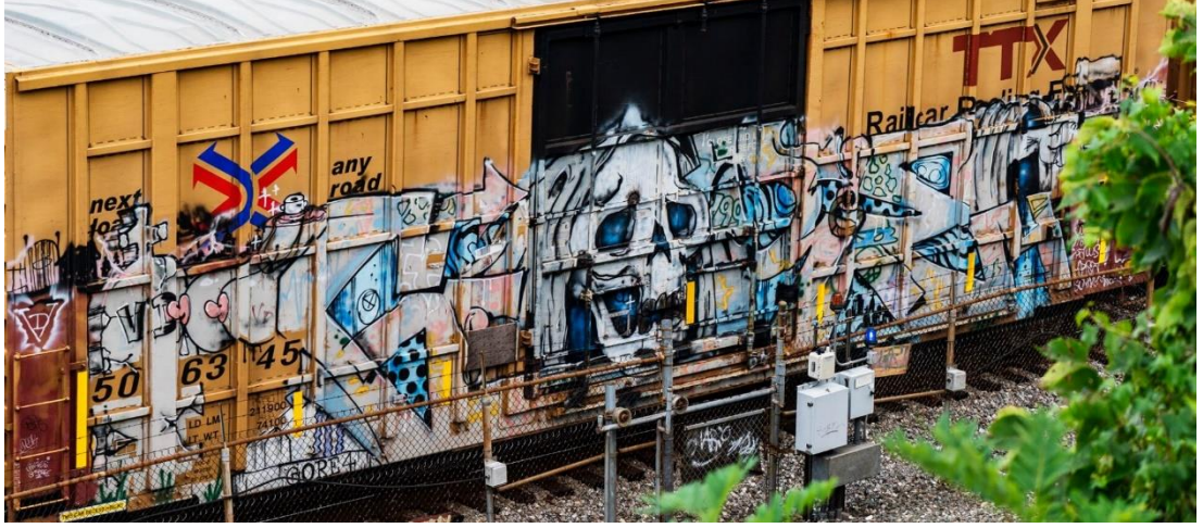
Görsel 2.5 Tren üzerine graffiti uygulamaları.

Austin (2016), trenlerin şehir içindeki rotalarına ve kapladıkları ağa dikkat çekmiştir. Bu yayılım göz önünde bulundurularak bir gün içerisinde iletişim haline geçtikleri kişi sayısı düşünüldüğünde, trenler üzerine uygulanan ve çoğunlukla yüzeyi kaplayan büyük boy graffitilerin sanatçıları için bu araçların “ideal bir yayın sistemi” niteliği kazandığı görülmektedir (s.225). Austin, New York şehrine ait bazı verileri paylaşmış, şehrin ana ulaşım arteri olarak nitelediği metro ağının; graffiti sanatı tarihinin ilk 20 yılı boyunca, 750 milden fazla yol katettiğini, çoklu hatlar üzerinden 4 şehrin ilçelerine ulaştığını, bu şekilde nüfusu 7 milyonu aşan bir şehirde günde 4 milyon kişiyi taşıdığını ortaya koymuştur (s.225). Tek bir şehre ait bu veriler bile tren üzerine yapılan uygulamaların görünürlük adına taşıdığı önemi göstermektedir.