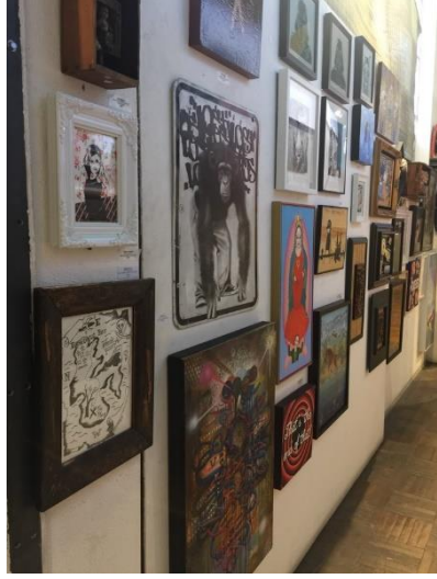
Görsel 3.6 La Luz De Jesus Gallery, Los Angeles, California, 2017.