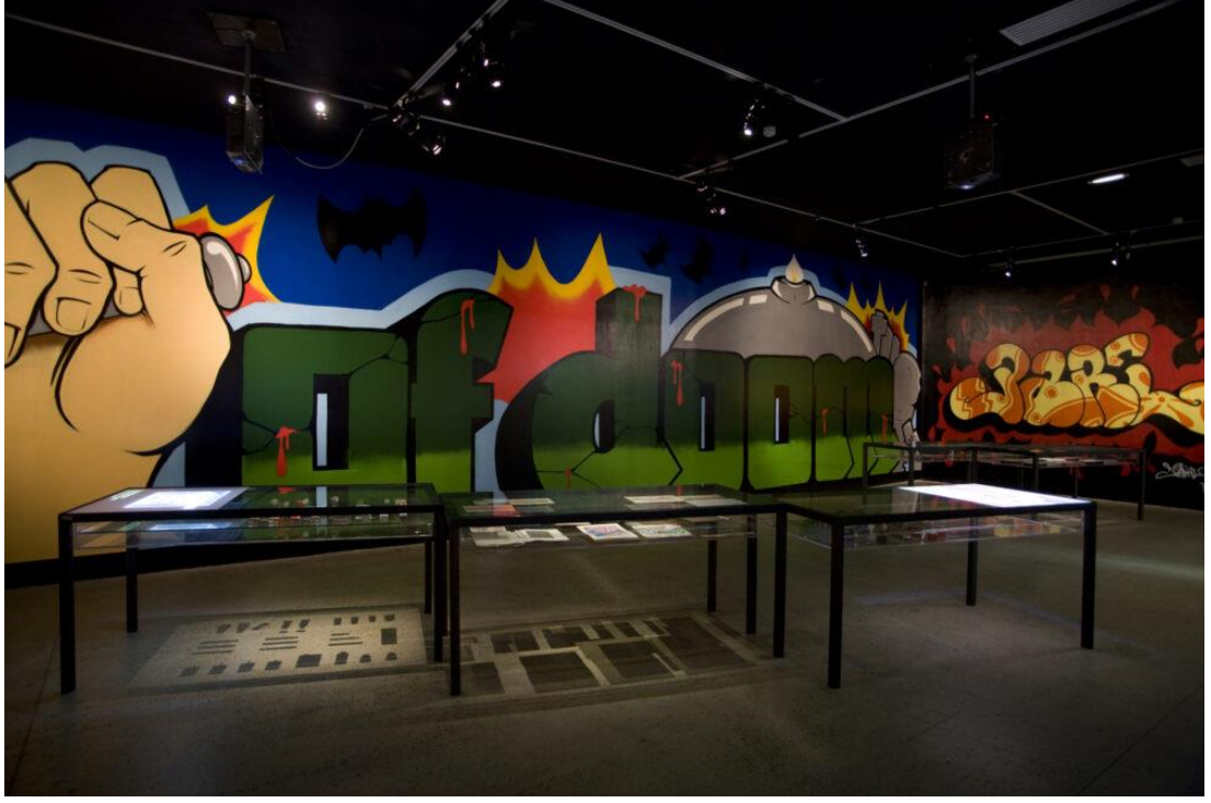
Görsel 2.29 Born in the Streets sergisi, Fondation Cartier, Paris, 2009.

Lewisohn'a ait olan yukarıdaki alıntıda geçen, sanatçının yaratım esnasında deneyimlediği tehlike hissinin izleyiciye geçmekte olduğu önermesi ışığında bakıldığında, izleyicinin müzedeki veya galerideki sokak sanatını izlediğinde söz konusu deneyimde bir eksiklik olacağı düşünülmektedir. Fakat yine bu önermeden yola çıkarak bu durum tam tersi bakış açısıyla yorumlanacak olursa da, eğer ki tehlike hissi yapıt aracılığı ile izleyiciye geçebilen bir durum ise; bu düşünce, ortamın, bulunduğu mekanın bu deneyimi etkilemeyebileceği sonucuna vardırırmaktadır. Bu durumda, sokakta üretilmiş sokak sanatı – atölyede üretilmiş sokak sanatı karşılaştırması yapılması uygun olmaktadır. Sokakta üretilmiş bir iş aracılığıyla, sanatçının deneyimlediği tehlike hissinin izleyiciye geçebiliyorsa; olduğu haliyle sokakta yaratıldığı yerden koparılarak bir müze veya galeriye getirildiğinde, yapıtın özündeki tehlikeye dair hissin kaybolmayacağı, sadece bir mekan değişikliğine uğrayacağı, bu haliyle söz konusu tehlikeye dair deneyimi izleyiciye daha korunaklı, sınırlı, steril bir mekanda, kısıtlı da olsa yaşatabileceği önerilmektedir. Yine de sokak faktörü yapıttan çıkarıldığında, bu deneyim bir dönüşüm geçirmektedir. Bunun sebebi sokakta yaratılan ve yaratıldığı mekanda kalan sokak sanatının çevresi ile var olan ve çevresini orada bulunduğu süre boyunca defalarca yeniden tanımlayan yapısıdır. Bu