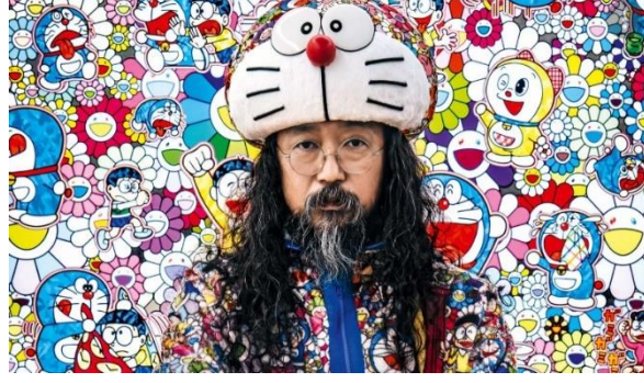
Görsel 3.8 Takashi Murakami

Bu çalışmanın önceki bölümlerinde de bahsedildiği üzere lowbrow hareketi veya sokak sanatını popülerleştiren tüm ticari, kültürel, sanatsal eylemler bu aşamaların birer parçası olmuştur. Superflat akımının bu çalışmada yeraltı çıkışlı hareketler olarak ele alınan diğer örneklerle bir arada incelenmeye uygun görülmesinin sebebi de yaratıcısı Takashi Murakami ve diğer temsilcilerinin yaratımlarını üzerine kurduğu ilham kaynakları, bu üretimlerin temelinde yer alan kökleridir.