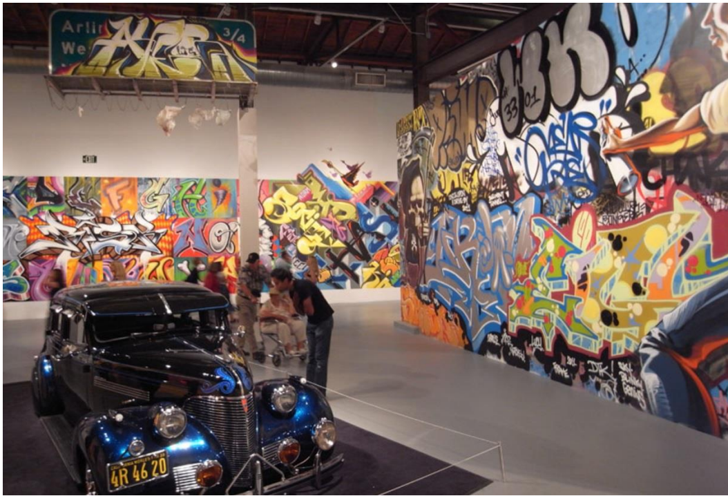
Görsel 2.6 Art in the Streets sergisi, MOCA, Los Angeles.

temsil ettikleri, bir başka deyişle ruhu ile son derece çelişki içerisinde görünse de pek çok sanatçı bu taleplere karşılık vermiş ve graffiti uygulamaları kaçınılmaz bir şekilde o yöne doğru da evrilmiştir. Tüm bu gelişmeler graffiti sanatçıları için sokak ve duvarlardan farklı ifade yolları da açmış; kimi sanatçılar galeri sergilerinde (bkz. Görsel 2.6), kimi sanatçılar mağazaların duvar ya da tabelalarını boyarken, kimileri ise ünlü markalara ait ürünlerin üzerinde çalışmalarının kullanılması adına anlaşmalar imzalarken görülür olmuştur. Böylelikle, bir zamanlar bir terör eylemi olarak tanımlanan graffiti; ticari, sanat ve devlet kurumları tarafından giderek daha fazla sahiplenilmeye başlamıştır (Lombard, 2013, s.91).