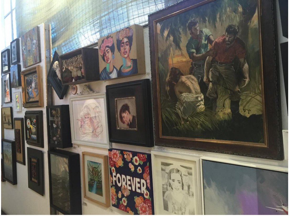
Görsel 3.5 La Luz De Jesus Gallery, Los Angeles, California, 2017.

açıldığı yıllarda sahip olduğu dekor ve yerleşimi olduğu haliyle korumaya özen göstererek yıllar sonrasına taşıyan kendine özgü atmosferi farkedilmektedir. La Luz de Jesus, geniş beyaz duvarların, uygun ışıklandırmaların, işlerin birbirine belli bir mesafede asıldığı sergileme anlayışının ve steril bir galeri görüntüsünün son derece uzağında bir anlayış benimsemektedir. Sadece bir galeri değil, temsil ettiği kültüre dair çeşitli eşyaların satışının yapıldığı, etkinlik ve buluşmaların düzenlendiği bir konsept mekan olarak ele alınan bu alanda, açıldığı 1986 yılından itibaren lowbrow sanat başta olmak üzere yeraltı kültürüne dair pek çok etkinlik düzenlemiştir.