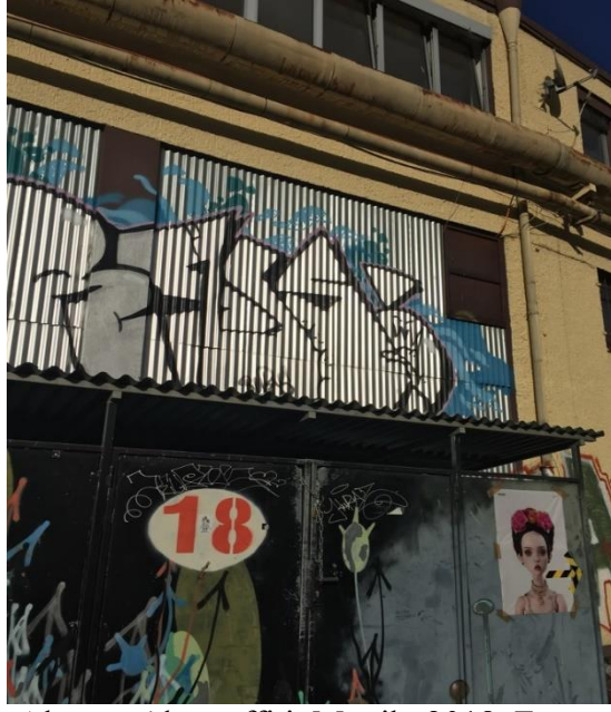
Görsel 2.2 Almanya'da graffiti, Münih, 2018