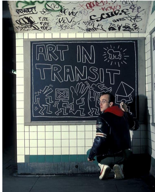
Görsel 2.13 Keith Haring, New York, 1984 Fotoğraf: Tseng Kwong Chi.

Keith Haring, graffiti ve sokak sanatı ile yüksek sanat arasında köprü görevi gördüğü düşünülen bir diğer sanatçıdır. Görsel 2.13 ile de örneklendiği üzere, reklam panoları üzerine çizdiği basit hatlara sahip figürler Haring için bir imza niteliği taşıyor olmuştur.