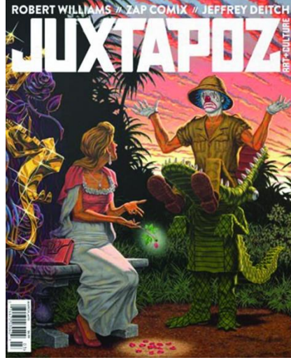
Görsel 3.7 Juxtapoz dergisi, Mart 2015 sayısı. Kapakta yer alan resim: Robert Williams, The Shattered Rose.