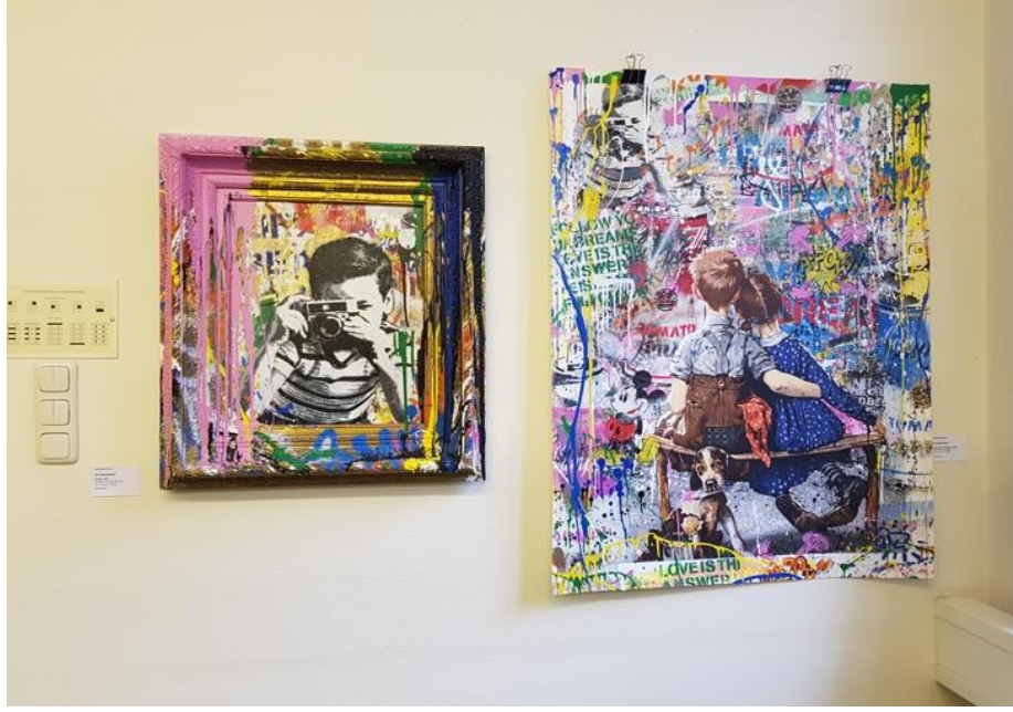
Görsel 2.19 Mr Brainwash, Stroke Art Fair, Münih, 2019.

çalışmada ele alınan ikinci grup şeklinde kategorilendirilmeleri uygun görülmüştür. Bu sanatçıların çalışma biçimlerine veya kurumlarla kurdukları ilişkiye bir diğer örnek olarak paylaşılan Görsel 2.20'de; Hush (solda) ve Mr.Brainwash (sağda) takma isimli sanatçıların işleri, 2017 yılında gerçekleşen Stroke Art Fair kurulumu içerisinde fotoğraflanmış halde görülmektedir.