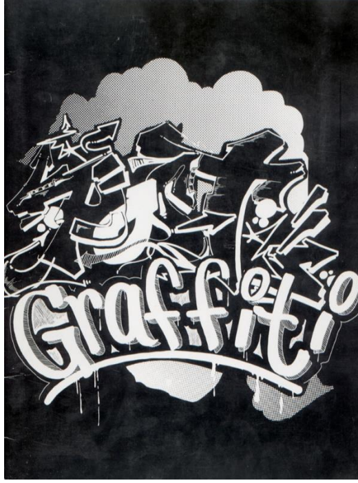
Görsel 2.8 Crash & Daze, Post-Graffiti sergi katalogu ön kapağı, 1983.