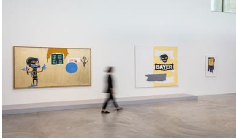
Görsel 2.14 Basquiat, Contemporary Art Museum St.Louis