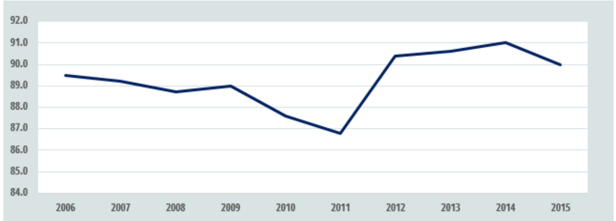
Grafik 2: Mısır'da Kırılğan Devlet Eğilimi (2006-2015)

Grafikten de görülebileceği gibi, 2010-2011 Yasemin Devrimi'nden esinle Mısır'da 25 Ocak 2011'de başlayan ve Cumhurbaşkanı Hüsnü Mübarek'in istifasına yol açan protestolar grafiğe olumlu yansımıştır. 2006'dan itibaren başlayan istikrarlı "kırılğanlığın" yerini 2011'de sert bir düzelmeye almıştır. Ancak düzelmeye daha da sert bir biçimde kırılğanlık hızla artmış Haziran 2012 Muhammed Mursi Mısır'ın ilk demokratik yollarla seçilen cumhurbaşkanı olması grafiğe kötüleşme olarak yansıtılmıştır. 2013 yılında ise askeri müdahale gerçekleşmesi grafiğe yeniden bir stabilizasyona işaret etmiş, 2014'ten itibaren görece düzelmeye yaşanmaya başlamıştır. Kuşkusuz grafiğin böyle bir trend izlemesinde hem ekonomik göstergeler hem de intikam arayan grupların şikayeti başta olmak üzere