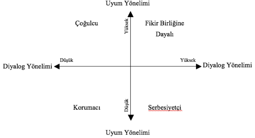
Şekil 2: McLeod ve Chaffee' nin Aile içi iletişim Kalıpları Aile Tipleri

McLeod ve Chaffee' nin Aile içi iletişim Kalıpları Aile Tipleri Şekil 2 de görülebilir.