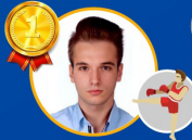
Mertcan Tapan Meslek Yüksekokulu